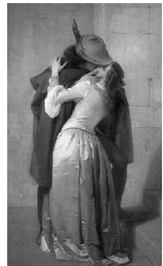
(Francesco Hayez . Le baiser)