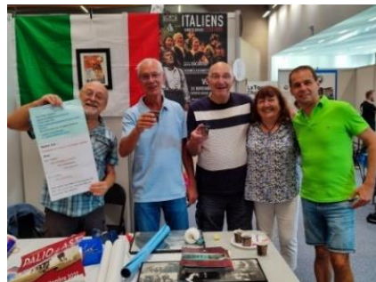
Membres du CA au travail

Comme chaque année, AVB était présente au Forum Sport et culture au Campus de la Brunerie. De nombreux voironnais se sont arrêtés au stand de l'association et se sont intéressés à nos activités à savoir la promotion de la culture italienne par des conférences, des rencontres, des voyages, des concerts et surtout le Festival de cinéma italien qui a lieu chaque printemps., aux cinémas PASSrL, à Voiron.