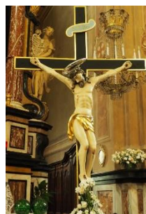
Christ de Mora

Ainsi s'achève notre escapade automnale dans une région méconnue de l'Italie, attrayante par ses paysages, sa gastronomie et sa culture.